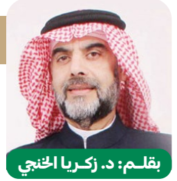
بقلم: د. زكريا الخنجي