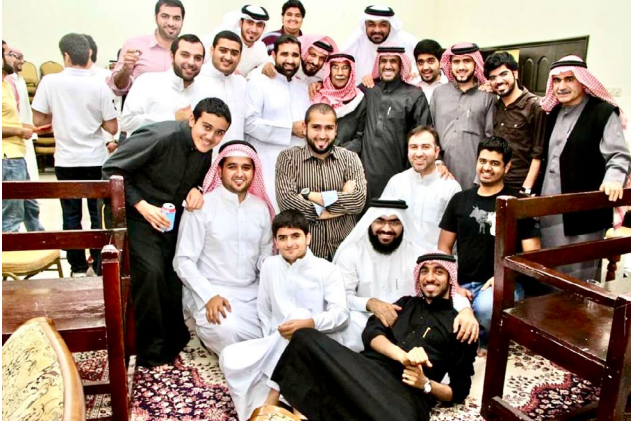
وفي لقاء مع شباب فرع الرفاع