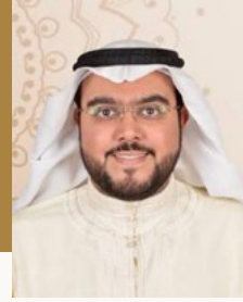
إعسداد: المهندس ناصر بن حسن الشيخ

ويبدأ بسورة الفاتحة وبيان معاني مفرداتها وأهم الفوائد واللطائف التدريبية.