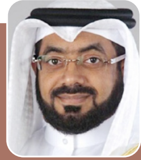
بقلم: الشيخ د. إبراهيم الحادي