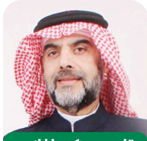
بقلم: د. زكريا الخنجي